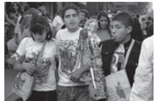
Auf der ganzen Welt wird der heilige Judas Thaddäus verehrt: San-Judas-Tadeo-Prozession in Mexiko-Stadt.