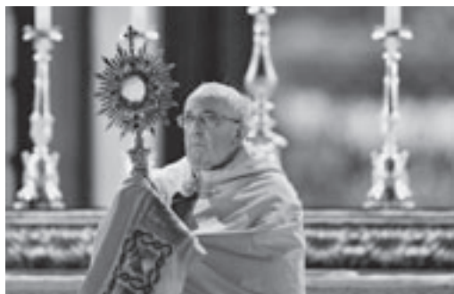
Papst Franziskus feiert das Fronleichnamsfest