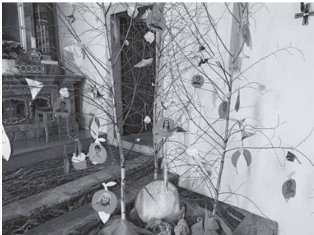
Die Erstkommunikanten haben am Besinnungsnachmittag die Bäume in der Kirche mit Schmetterlingen verziert.

Das Leben in Fülle wünschen wir ihnen, den Eltern und Taufpaten.